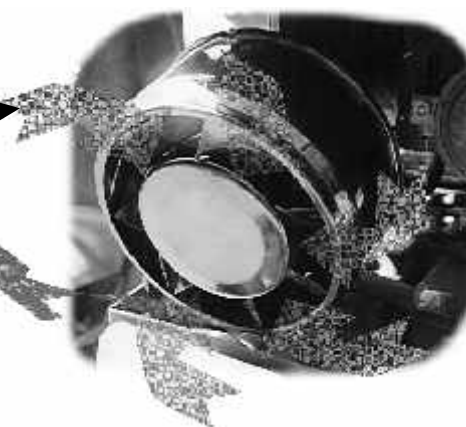
Eliminación de Impurezas por los cortes de expulsión laterales