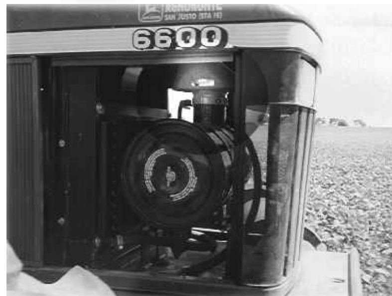
*LOS GRÁFICOS INDICAN LA POSICIÓN CORRECTA DEL PRE-FILTRO